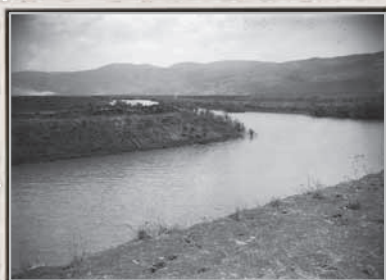
נחל הקישון, 1930