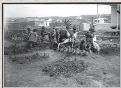
כפר גדעון, ילדים בגן הירק, 1926

"תספרו בבית שאכלתם במושבה יהודית אמיתית. כל מה שעלה על השולחן: הלחם, הבשר, הסלט, תבשיל הירקות, הפירות והדבש - הכול תוצרת עצמית, 'תוצרת הארץ'. מכולם נלקחו תרומה ומעשר כהלכה. אנחנו חיים פה חיים יהודיים אמיתיים. ואני אומר שיש גם צורך במה שראיתם לפני הצהריים בקבוצות. הם היו החלוצים שלנו, הם אלה שסללו את דרכנו. אלמלא הם, לא היינו יכולים להתיישב כאן ולהקים בתי-הכנסת אורתודוקסיים וללמוד בכל ערב את התלמוד. אלמלא הם, לא היה לנו לא שוחט טוב ולא מקווה. זאת האמת."