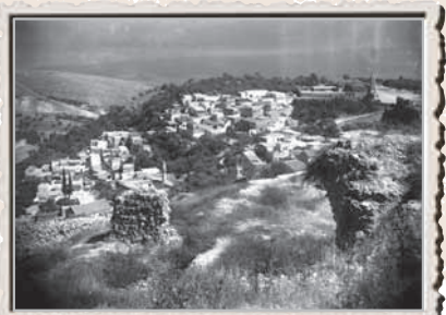
צפת, מבט מהמצודה, 1927