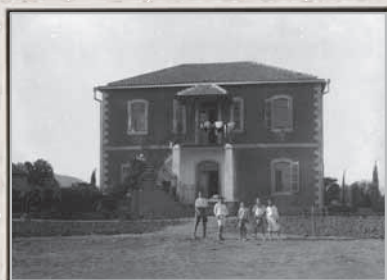
דגניה, המבנה הראשון, 1920

"במקום בו הירדן נפרד מים כנרת, נמצאות דגניה וכנרת, מושבות יהודיות יפהפיות, מוקפות בחורשת דקלים ובפרדסי תפוזים. בחדר האוכל המשותף שלהן מתנהלים דיונים סוערים בעברית על משק שיתופי ופרטי, על אישיותו של טולסטוי ועל ביאליק. הערב דובר אפילו על "חזון האדם", המחזה הגדול של מדאץ', שיצא עכשיו לאור בעברית, בתרגומו של המאירי-פיינערשטיין ועורר השתאות בכל קוראיה היהודיים של פלשתינה."