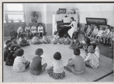
גן ילדים, 1920 לערך