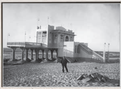
חוף תל אביב, בניין הקזינו, 1923 אדריכלי הקזינו: יהודה מגידוביץ' מאוסה וארפד גוט מבדפשט צלם: סוסקין, אוסף פרטי