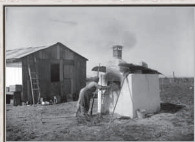
כפר גדעון, אפיית הלחם בטבון, 1926