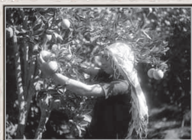
פתח תקווה, קטיף תפוזים, 1926