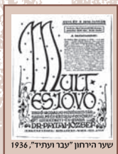
שער הירחון "עבר ועתיד", 1936