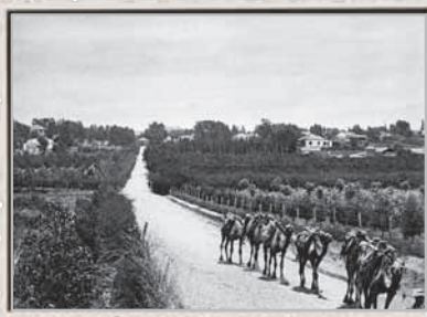
אורחת גמלים בפרדסים, 1921

כך תיאר פטאי את תל אביב בשעות הערב: "כשחזרתי לתל אביב מן הסיור הבלתי נשכח שלי בשרון, כבר הייתה שעת ערב מאוחרת. העיר העברית החדשה בהקה באור מנצנץ. אורות החשמל האירו את צללי הדקלים המיתמרים לשמים, בינות לעצים הצטלצלה שירה עברית רכה. זו הייתה הנפשה של סימפוניה מזרחית. תל אביב שרה. החלוצים חזרו הביתה מן הפרדסים, הבנאים מעבודות הטיח, והנערים והנערות מסלילת הכבישים. הם הציפו את הרחוב משיחים ומזמרים באושר. רבים הלכו לכיוון הטיילת בשדרות רוטשילד, אחרים פנו אל חוף הים המואר באור הלבנה. גם הסטודנטים הניחו את ספריהם וגם הזקנים יצאו מבתיהם והתערו בהמוני המזמרים."