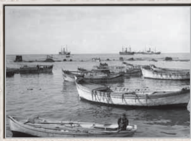
נמל תל אביב, 1920 לערך