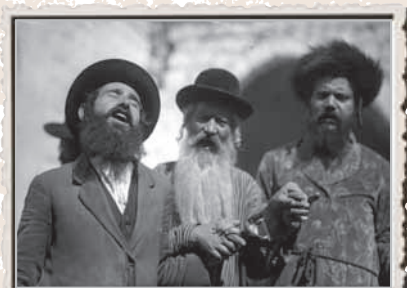
הילולה בהר מירון, 1927