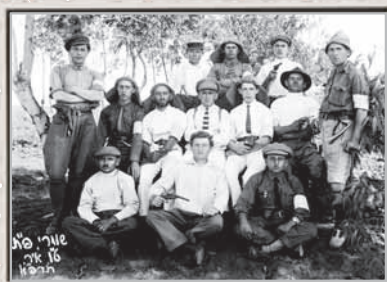
פתח תקווה, השומרים, 1921

"יהושע שטמפפר היה אדם דתי מאוד והנהיג את המושבה ברוח הדת. ובכל זאת, הוא זה שנתן פקודה לחילול השבת ועוד בבית-הכנסת. בשבת לפני הצהריים בשעת התפילה, הגיעה הידיעה שהבדווים פרצו אל הקולוניה. שטמפפר קטע את תפילת שמונה-עשרה החרישית, השליך את הטלית שלו וקרא לכל המתפללים להפסיק מיד את התפילה ולרוץ איש-איש אל נשקו. התכנון של הבדווים השתבש, ואנחנו הצלחנו לנטרל באופן מזהיר את יסוד ההפתעה בשבת."