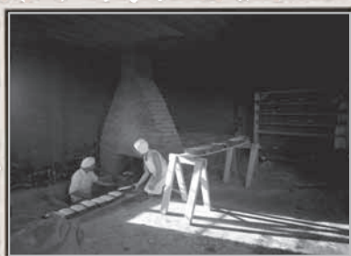
פתח תקווה, מאפית הלחם, 1935 צלם: שווייג, ארכיון הצילומים קק"ל