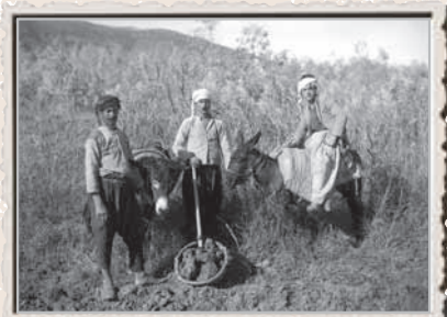
רוכבי חמורים, 1927