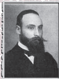
פרופ' שמואל קליין (1886-1940)

סופר, משורר, מחזאי, מתרגם ועורך כתבי-עת. ב-1921 עלה לארץ. ב-1927 ייסד וכתב חלק גדול מן הרפרטואר של התיאטרון הסאטירי העברי הראשון, "הקומקום". חתן פרס ישראל צלום מ-1927 מוזיאון למורשת היהדות הדוברת הונגרית