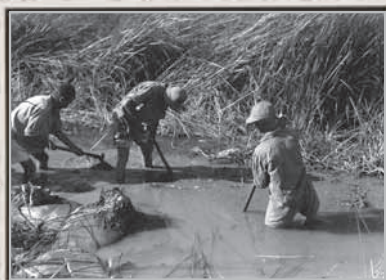
יבוש ביצות