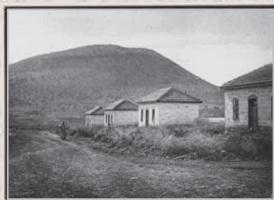
כפר תבור, מסחה, 1921