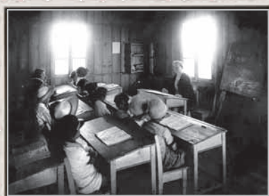
כפר גדעון, בית הספר, 1926