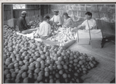
פתח תקווה, אריזת תפוזים, 1926