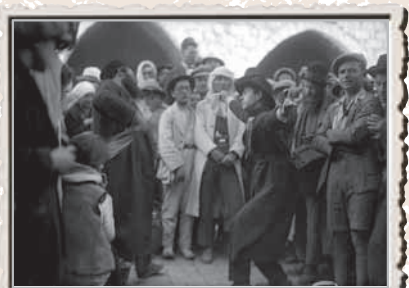
הילולה בהר מירון, 1927